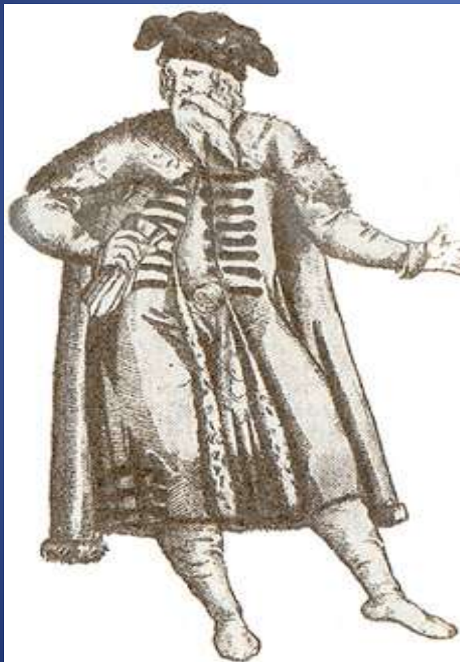
Русский купец XVI в.