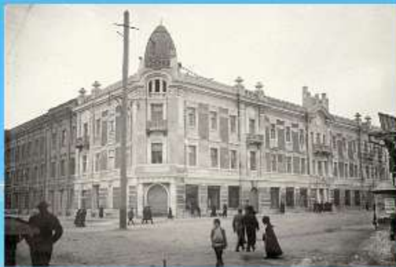
Торговый дом с жилыми помещениями купца I -ой гильдии